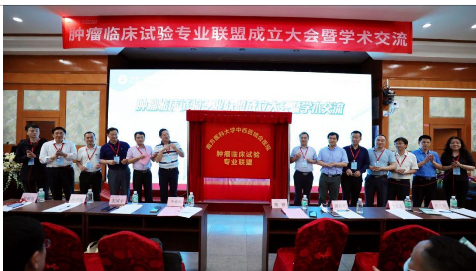
肿瘤临床试验专业联盟揭幕仪式