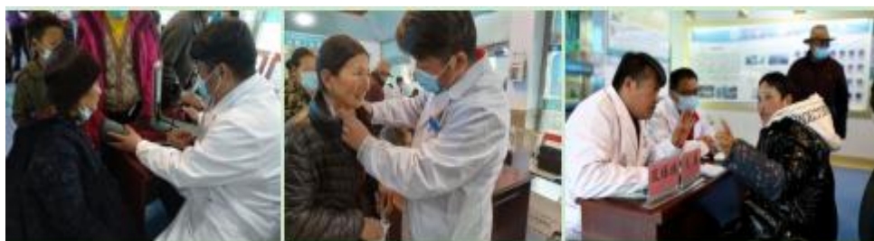
及臻臻医生在义诊活动中为当地群众测量血压、检查、答疑

4 月 17 日，义诊活动按计划进行。由于医疗队提前和波密县人民医院沟通联系，县医院对本次活动宣传积极配合，一大早就有很多当地群众前往候诊。虽然语言不通，但及医生在县医院医生的协助下，仔细为患者检查，给他们详细讲解了疾病基础知识、预防知识和治疗知识等，并把医院送来的爱心药品派发给有需要的患者，指导他们正确服药。