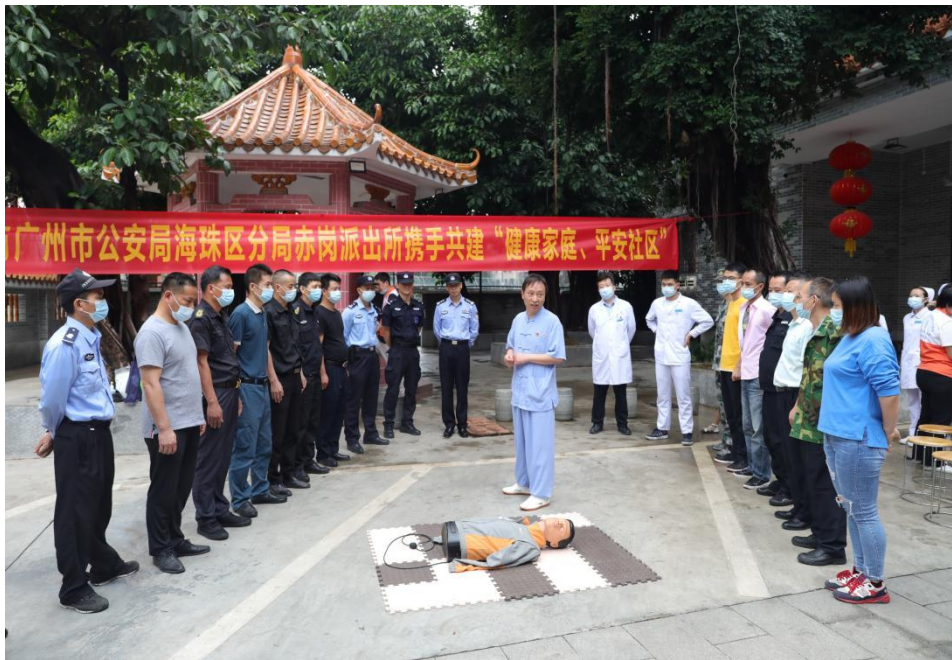
健康养生知识培训